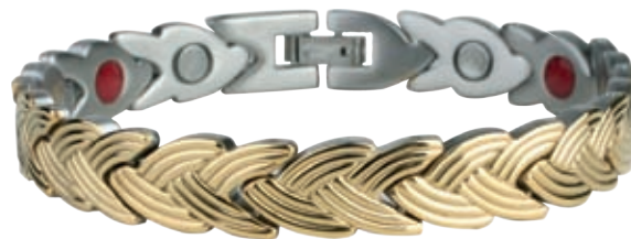
SB 443 | /19см/ ●●●● /магнити, инфрачервени лъчи, отрицателни йони/ Цена: 115.00 лв.