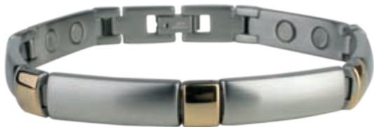
SB 435 /20см/ ●●●●● /магнити, инфрачервени лъчи, отрицателни йони, германий/ Цена: 125.00 лв.