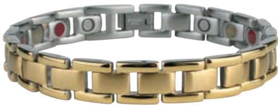
SB 439 /19см; 21см/ ●●● SB 439F* ●●●● /19см; 21см/ /магнити, инфрачервени лъчи, отрицателни йони, германий*/ SB 439 - Цена: 115.00 лв. SB 439F-122.00 лв.