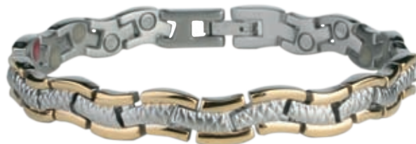
SB 450 | /19см/ ●●●● SB 450F* ●●●●● /19см/ /магнити, инфрачервени лъчи, отрицателни йони, германий*/ SB 450 - Цена: 115.00 лв. SB 450F-122.00 лв.