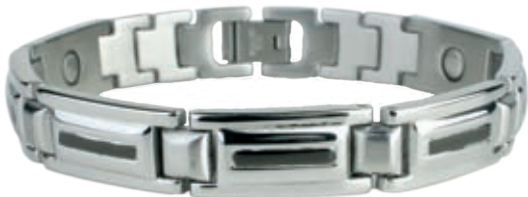
SB 445 /19см; 21см/ ●●●●● SB 445F* ●●●●● /19см; 21см/ /магнити, инфрачервени лъчи, отрицателни йони, *германий/ SB 445 - Цена: 122.00 лв. SB 445F* - Цена: 135.00 лв.