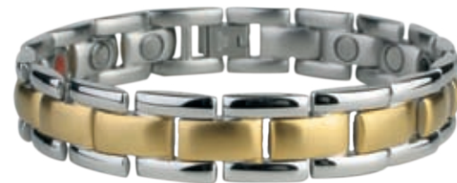
SB 440 /19см; 21.5см/ ●●●●● /магнити, инфрачервени лъчи, отрицателни йони, германий/ Цена: 122.00 лв.