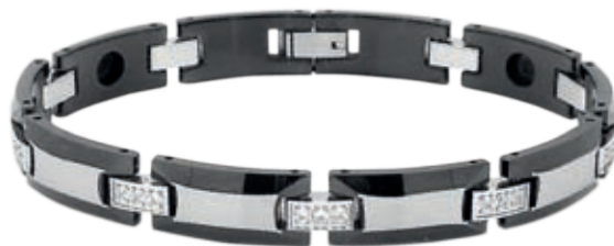
SB 441F /19см; 21см/ ●●●● /магнити, инфрачервени лъчи, отрицателни йони, германий*/ SB 441F-174.00 лв.