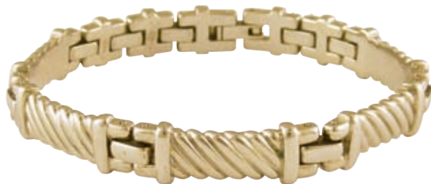
SB 474 / 19см/ ●●●● /магнити, инфрачервени лъчи, отрицателни йони, германий/ Цена: 112.00 лв.