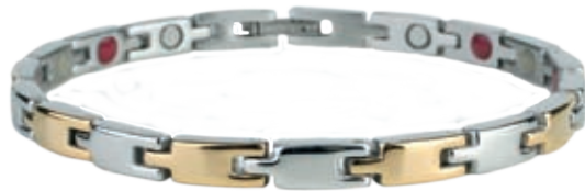
SB 432 | /19см/ ●●● SB 432F* ●●●●/19см/ /магнити, инфрачервени лъчи, отрицателни йони, германий*/ SB 432 - Цена: 108.00 лв. SB 432F-115.00 лв.