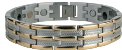
SB 437 /21.5см; 23см/ ●●●●● SB 437F* ●●●●● /21.5см; 23см/ /магнити, отрицателни йони, инфрачервени лъчи, * германий/ SB 437 - Цена: 119.00 лв. SB 437F-128.00 лв.