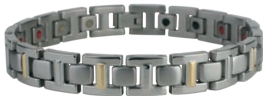
TB 430 | /21.5см; 23см/ ●●● /инфрачервени лъчи, отрицателни йони, германий/ Цена: 145.00 лв.