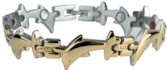
SB 436 /19см/ ●●●● /магнити, инфрачервени лъчи, отрицателни йони/ Цена: 115.00 лв.