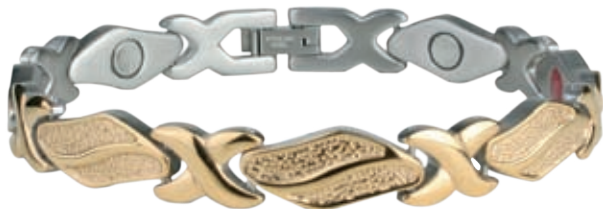
SB 446 | /19см/ ●●●● /магнити, инфрачервени лъчи, отрицателни йони/ Цена: 115.00 лв.