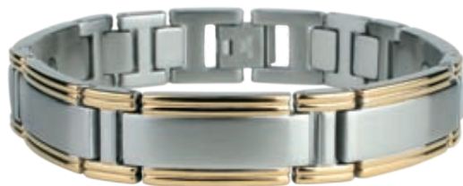
SB 428 | /19см; 21см/ ●●● /магнити, инфрачервени лъчи, отрицателни йони/ Цена: 115.00 лв.