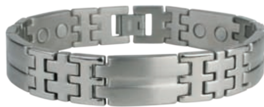
TB 429 /21.5см; 25.5см/ ●●●●● /магнити, инфрачервени лъчи, отрицателни йони, германий/ Цена: 136.00 лв.