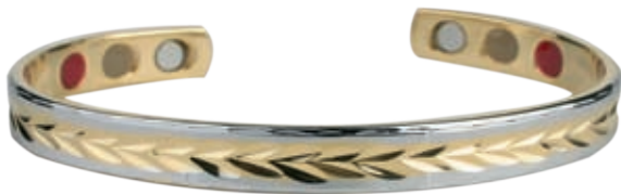
CB 448 | /19см/ ●●●● /магнити, инфрачервени лъчи, отрицателни йони/ Цена: 84.00 лв.