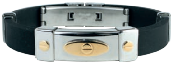
SB 427 | /19 см; 21см/ ●● /магнити, германий/ Цена: 94.00 лв.