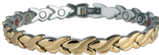
SB 434 /19см/ ●●● SB 434F* ●●●● /19см/ /магнити, инфрачервени лъчи, отрицателни йони, германий*/ SB 434 - Цена: 115.00 лв. SB 434F-122.00 лв.