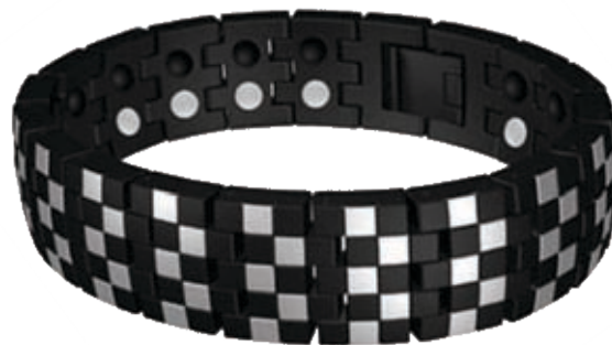
SB 475 / 20см; 22см/ ●●●● /магнити, инфрачервени лъчи, отрицателни йони, германий/ Цена: 129.00 лв.