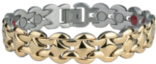
SB 444 /19см/ ●●●●● /магнити, инфрачервени лъчи, отрицателни йони, германий/ Цена: 128.00 лв.