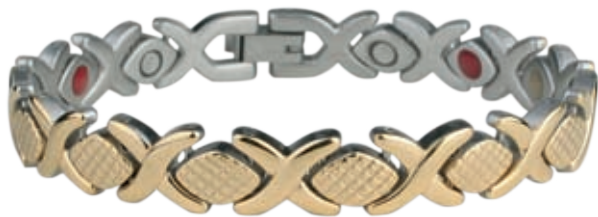
SB 442 | /19см/ ●●●● /магнити, инфрачервени лъчи, отрицателни йони/ Цена: 115.00 лв.