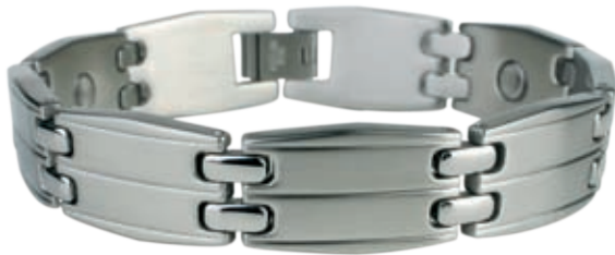
SB 431 | /19см; 21см/ ●●● /магнити, инфрачервени лъчи, отрицателни йони/ Цена: 115.00 лв.