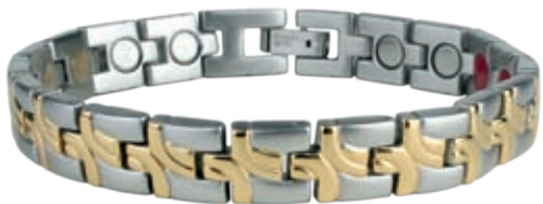
SB 433 /19см/ ●●● SB 433F* ●●●● /19см/ /магнити, инфрачервени лъчи, отрицателни йони, германий*/ SB 433 - Цена: 108.00 лв. SB 433F-115.00 лв.