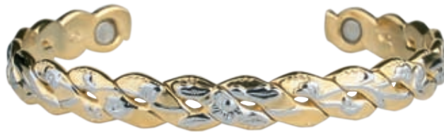
CB 447 | /19см/ ● /магнити/ Цена: 73.00 лв.