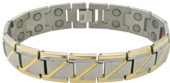
SB 473 / 20см; 22см/ ●●●● /магнити, инфрачервени лъчи, отрицателни йони, германий/ Цена: 122.00 лв.