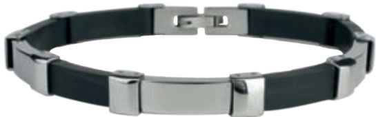
SB 426 | ●●● /магнити, инфрачервени лъчи, отрицателни йони/ Цена: 94.00 лв.