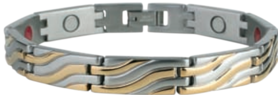
SB 438 /19см/ ●●● SB 438F* ●●●● /19см/ /магнити, инфрачервени лъчи, отрицателни йони, германий*/ SB 438 - Цена: 108.00 лв. SB 438F-115.00 лв.