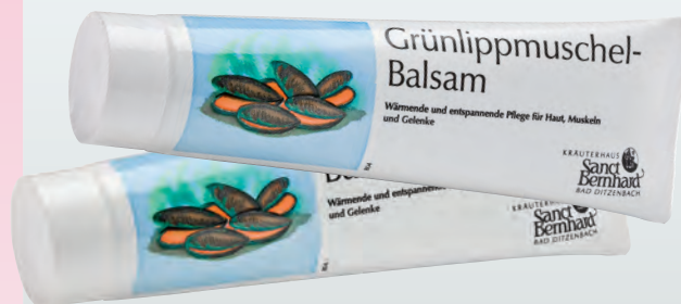
Количество: 150 ml Cod: 50140 Цена: 26 лв.

Стоп на болката и дискомфорта в стави, сухожилия и мускули!