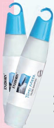
Количество: 400 ml Код: 50128 Цена: 26.00 лв.