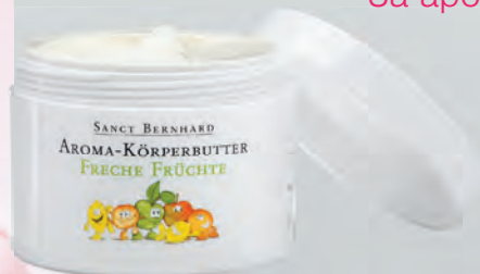
Количество: 200 ml Код: 30457 Цена: 28.00 лв.

За ароматна и здравословна грижа за кожата на малките съкровища