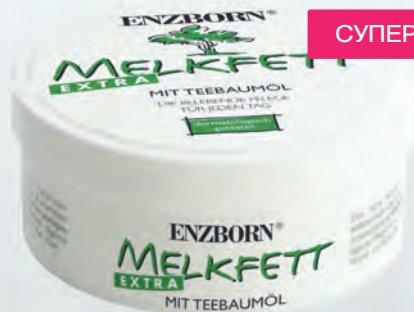
Код: 50106 Цена: 10.00 лв. Количество: кутия от 100 ml