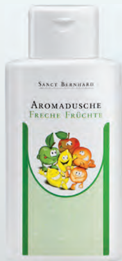
Количество: 250 ml Код: 30458 Цена: 19.50 лв.

За ароматно и здравословно къпане на малките съкровища