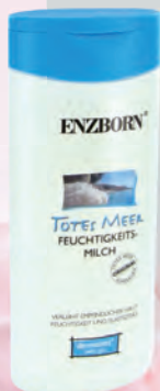
Количество: 250 ml Код: 50130 Цена: 26.00 лв.