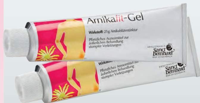
Количество: 150 ml Код: 50141 Цена: 26 лв.

Активни съставки: В 100 грама гел се съдържа като активното вещество - 25 г тинктура от арника(1:10).