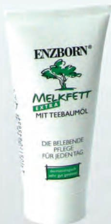
Код: 50105 Цена: 5.00 лв. Количество: туба от 30 ml