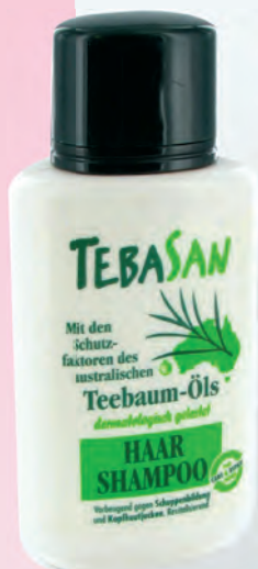
Код: 50102 Цена: 19.50 лв. Количество: флакон от 200 ml