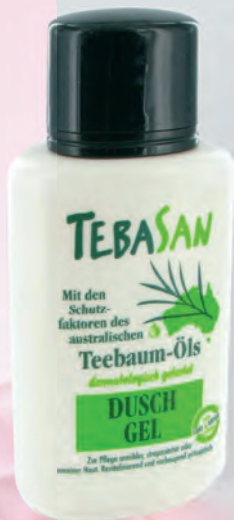
Код: 50101 Цена: 19.50 лв. Количество: флакон от 200 ml