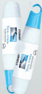
Количество: 400 ml Код: 50129 Цена: 26.00 лв.